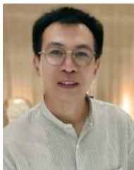
อ.ปิลลพ ส้าารุกษ์